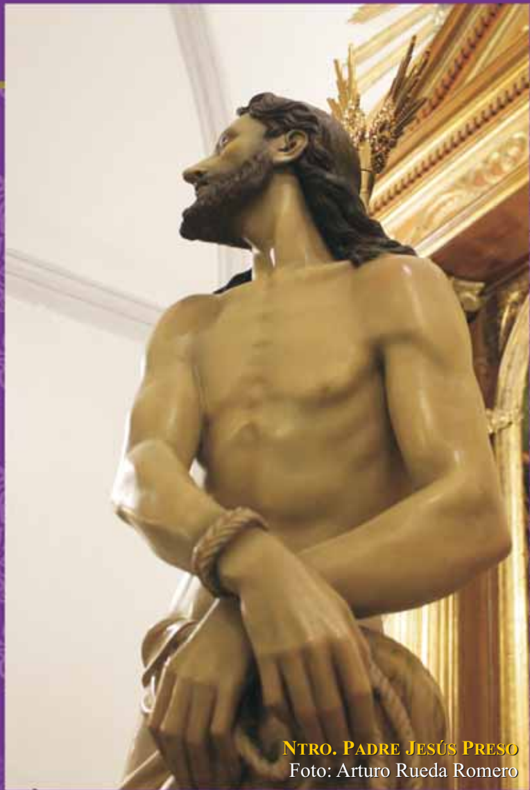
INTRO. PADRE JESÚS PRESO